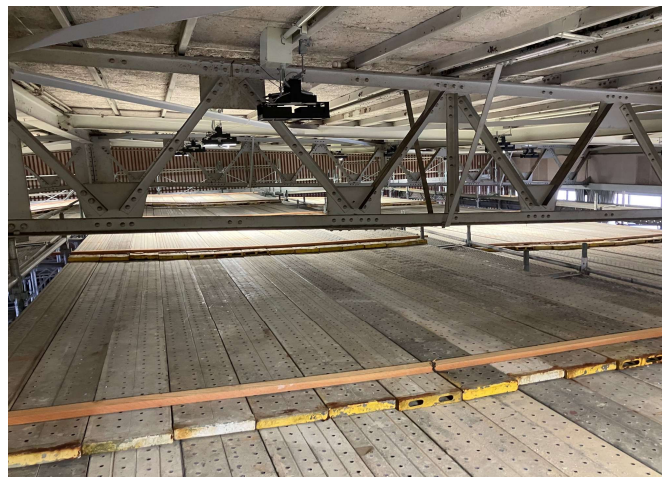
外注業者にて体育館棚足場組OK