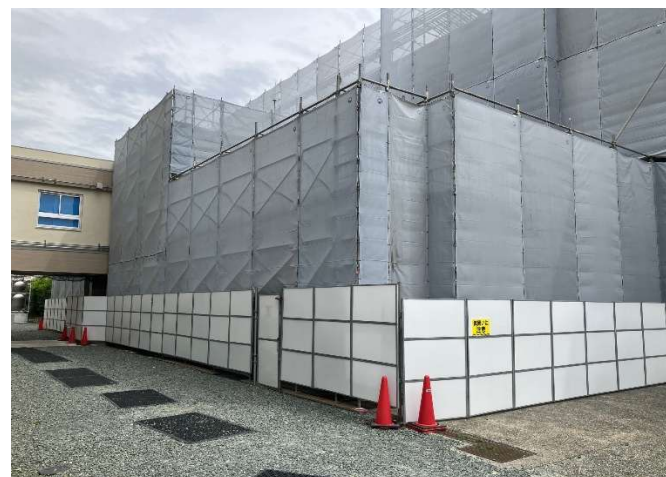
外注業者にて外部足場組OK