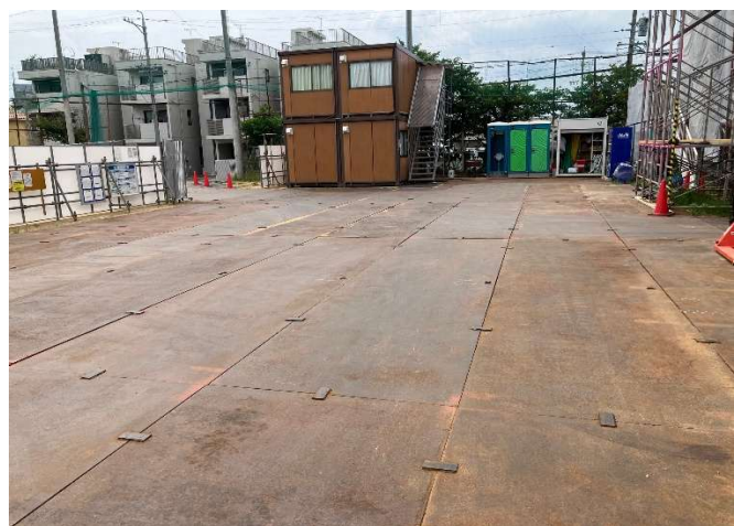
外注業者にて鉄板敷&溶接OK