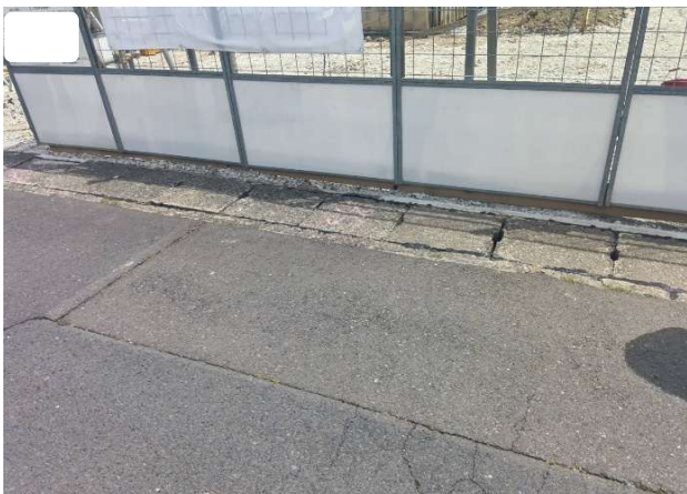
③ フェンス下巾木設置良好