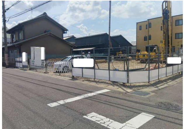
② 現場正面パネルフェンス良好