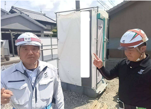
① パトロール前服装点検