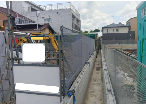
③ バリアネットフェンス施工良好