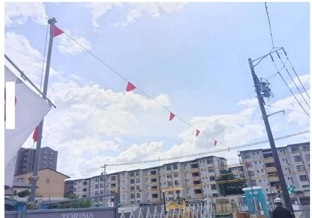
④ 高さ表示トラロープの設置OK