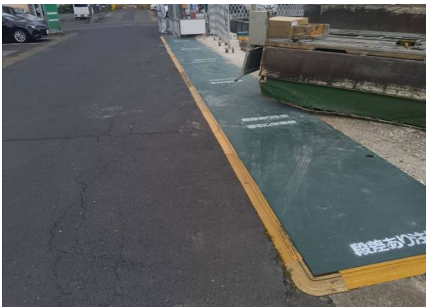
⑤ 養生鉄板敷設良好