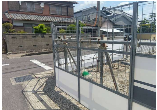
④ メッシュ施工にて交差点の見通し良好