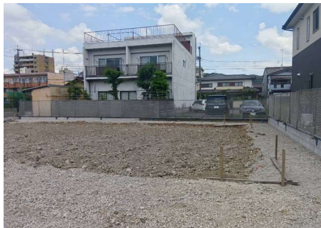
④ バリアネットフェンス設置良好