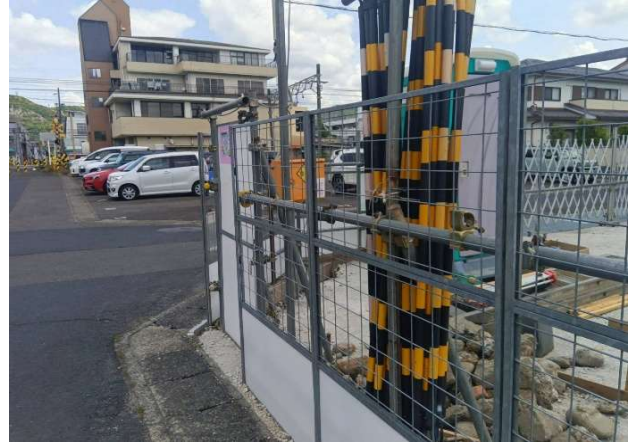
② メッシュ施工にて交差点の見通し良好