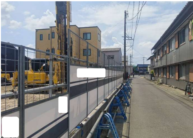
③ 道路面パネルフェンス良好