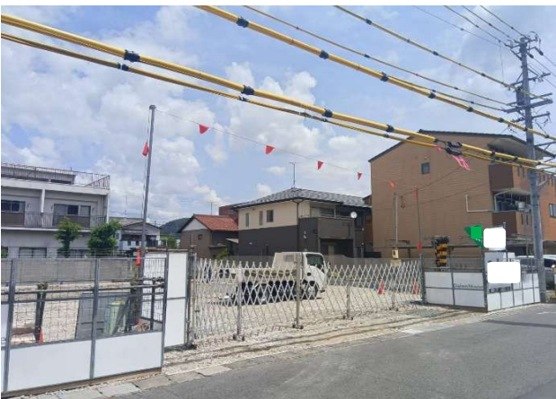
⑤ 高さ表示トラロープの設置OK