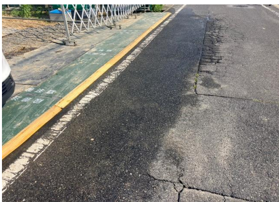
乗り入れ鉄板状況 しっかり溶接されておりました