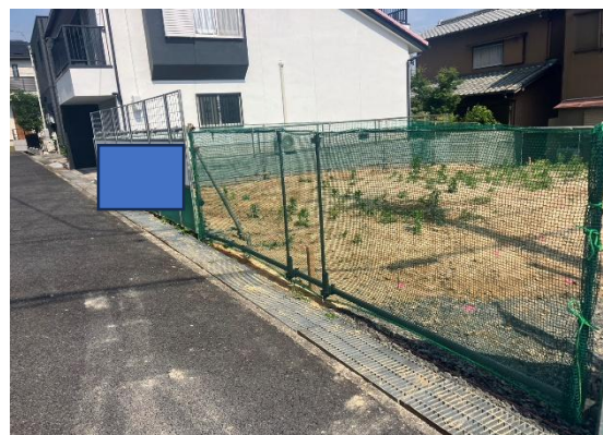
ネットフェンス状況 問題ありませんでした