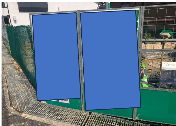
正面 看板状況 施工当日 雨がひどく材料に泥が付着（看板枠等） パトローラーにて清掃済み