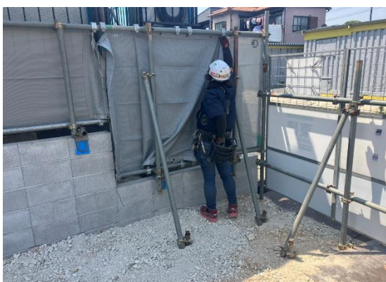
施工風景 道具や健康状態等 問題ありませんでした