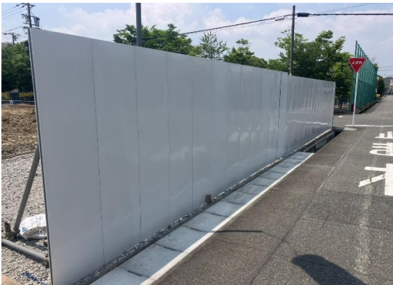
正面 万能板施工状況 きれいに組みまれていました