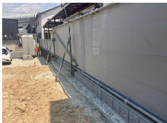
側面 シートフェンス状況 問題ありませんでした