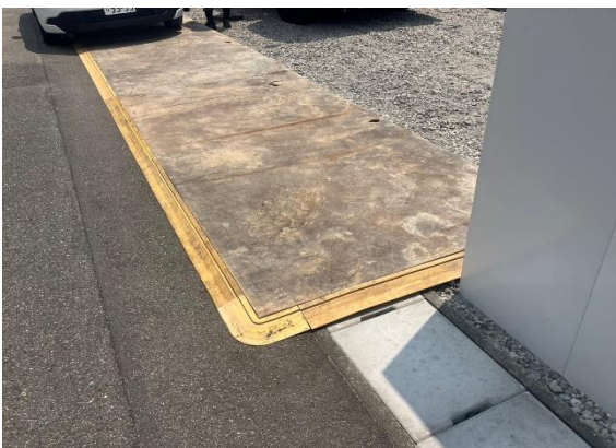
乗り入れ鉄板状況 問題ありませんでした