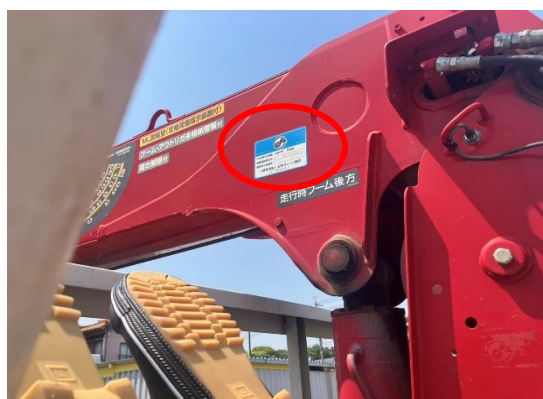
トラッククレーンの年次点検 問題ありませんでした