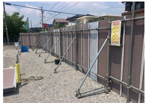
万能板骨組み状況 控えの角度、長さ等 綺麗におさめてありました