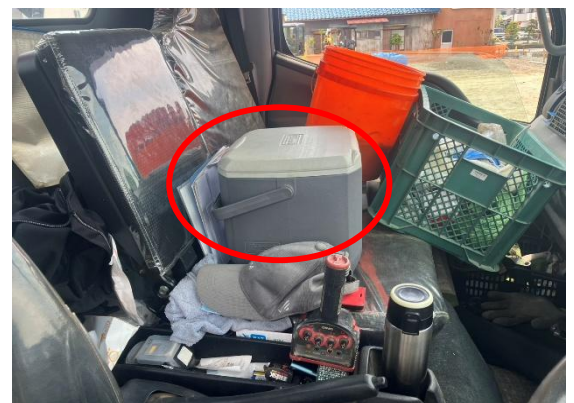
熱中症対策されておりました (水分多めに)