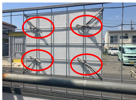
掲示物の紐が外に出ないように配慮されていました