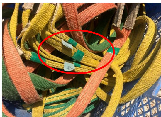
毎月のスリングベルト点検済み状況になります