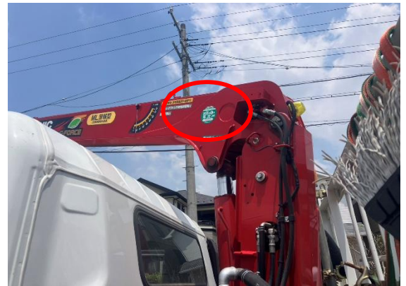
トラッククレーンの年次点検 問題ありませんでした