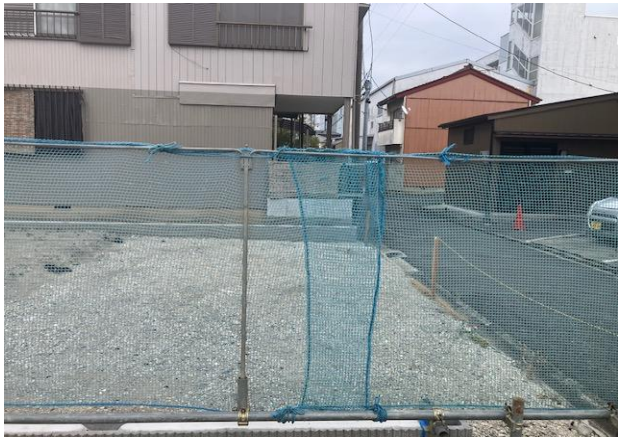
バリアネット施工・合わせ巾良好