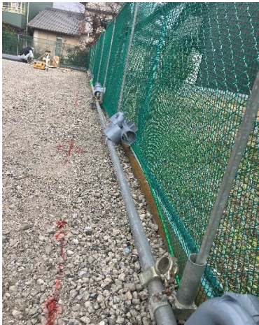
バリアネット施工良好でした