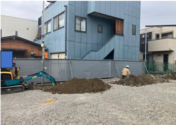
単管シートフェンス施工良好でした