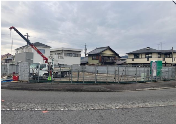
全景 ①上・中・下段メッシュ施工 施工状態良好