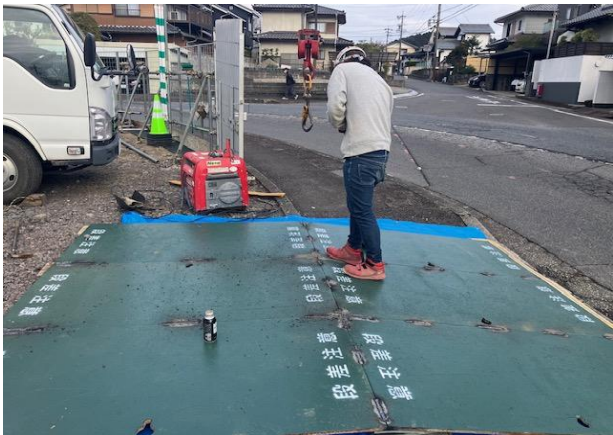
鉄板設置・溶接後の清掃OK