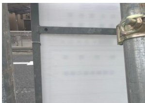
養生テープ剥がし忘れ（左写真） パトロール者で剥がしました（右写真）