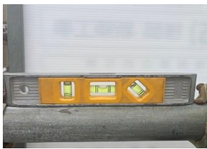
横地わずかに水平出てませんでした（左写真） パトロール者で直しました（右写真）