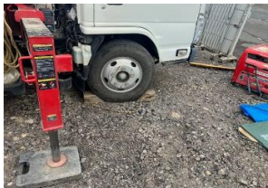
スリングロープ今月の点検色（緑）OK アウトリガー敷板OK タイヤ輪止めOK