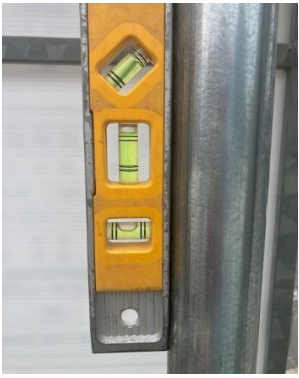
建地傾きあり（左写真） パトロール者で直しました（右写真）