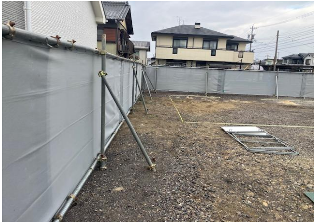
単管シートフェンス施工良好