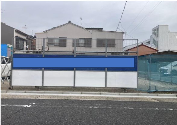
正面仮囲い 足元の間隙大きいのでもう少し下へ落した方が良い