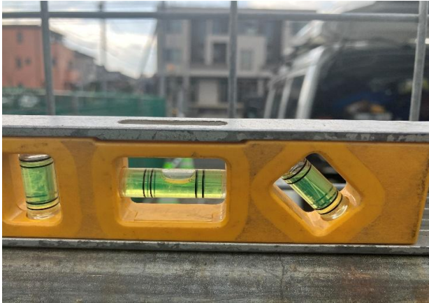
①正面仮囲いわずかに水平出ていません パトロール者で当日直しました