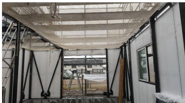
建方現場水平ネット設置