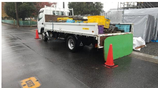
トラック周りカラーコーン設置