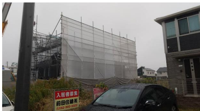
建方中足場 ネット写真